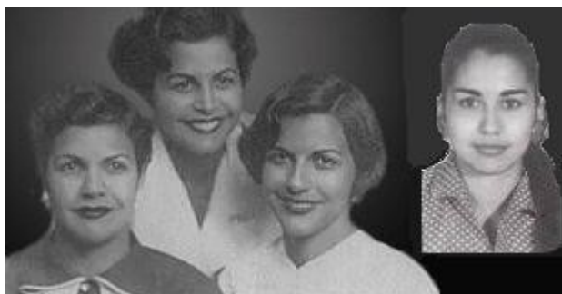
De izquierda a derecha: Patria, Dedé, Minerva y María Teresa

Minerva consigue graduarse en 1946 de la carrera en Letras y Filosofía con excelentes notas, durante su último año su hermana María Teresa se integra al Colegio Inmaculada Concepción.